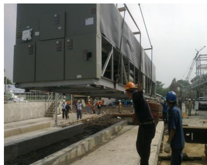
Chiller RTAC 375-MEIJ Pasuruan-on Foundation