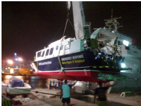
Tri RatnaDiesel Patroli Boat