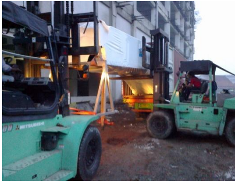
Escalator ForPasarTuri Mall