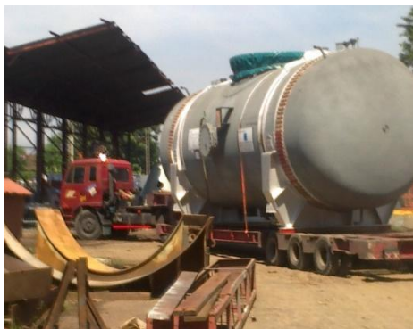
Water Tank For Power Plant