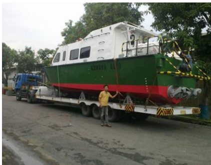
Crew Boat-Sam Marine