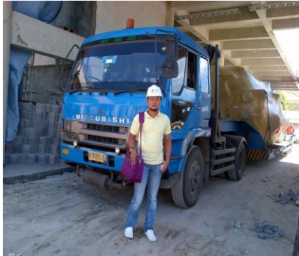
Chiller CVHG1100-Bali Airport