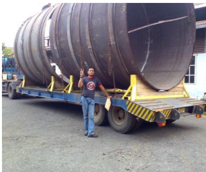
Spool Pipe- Paiton Power Plant