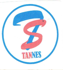
NAMA; LOGO; WARNA