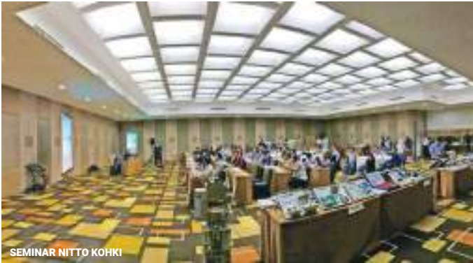
SEMINAR NITTO KOHKI