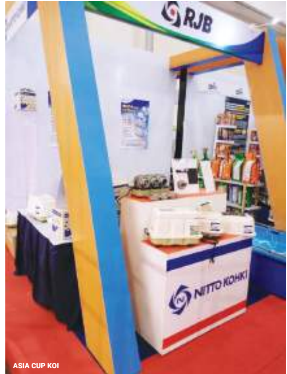
ASIA CUP KOI