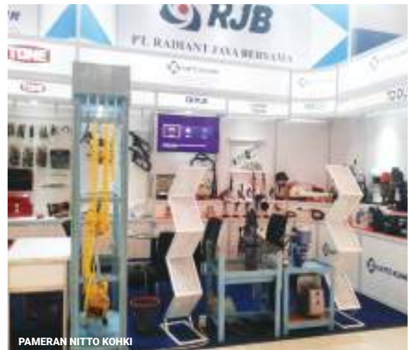
PAMERAN NITTO KOHKI