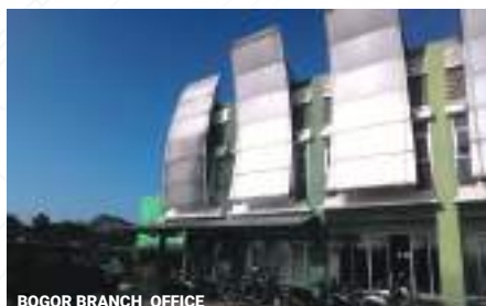
BOGOR BRANCH OFFICE