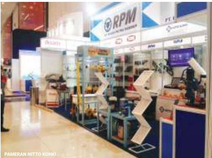
PAMERAN NITTO KOHKI