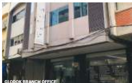
GLODOK BRANCH OFFICE