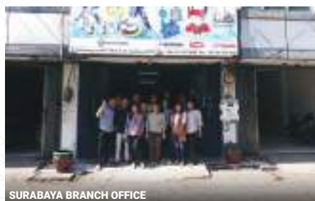
SURABAYA BRANCH OFFICE

Untuk memberikan dukungan yang lebih baik untuk semua pelanggan kami, kami membutuhkan lingkungan dan system yang lebih baik. Oleh karena itu, saat ini kami telah memiliki beberapa kantor cabang dan untuk mendukung kegiatan penjualan, kami akan mengembangkan kantor-kantor cabang lainnya.