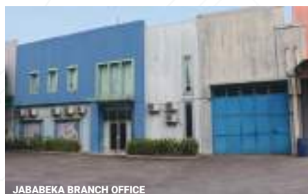
JABABEKA BRANCH OFFICE