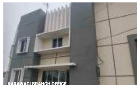
KARAWACI BRANCH OFFICE