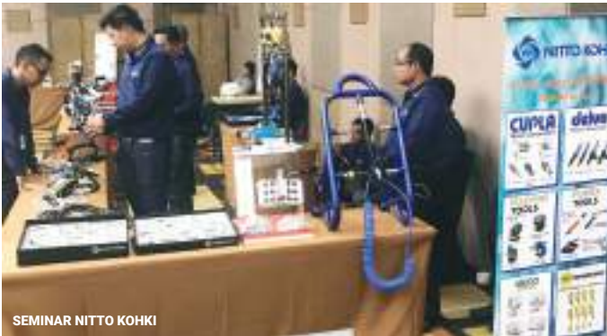
SEMINAR NITTO KOHKI