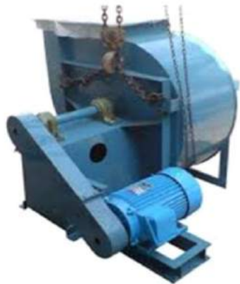
ID Fan System