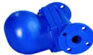
Ball Float Steam Trap

Rukan Ngoro Industri Persada B-3, Ngoro - Mojokerto Jawa Timur Email. sales@tunasbarutama.com Telp. 0321- 6820 382