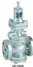
Pressure reducing valve