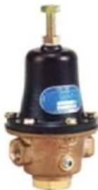
Water Pressure Reducing valve