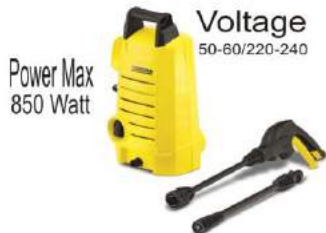
KARCHER K1 High Pressure Cleaner

SEDIA : MUR BAUT, ELECTRIC PART, POWER TOOL & ACCESORIES SAFETY EQUIPMENT