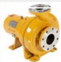
Vortex Centrifugal Pump