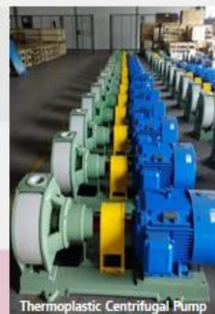
Thermoplastic Centrifugal Pump