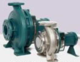
Chemical Centrifugal Pump