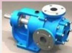
Gear Pump for handling high viscosity