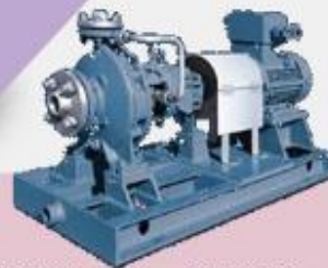
API 610 Process Pump OH1 & OH 2