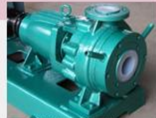
PFA Lining Chemical Pump