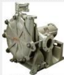
Heavy Duty Pump