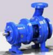
ANSI B73.1 Chemical Process Pump